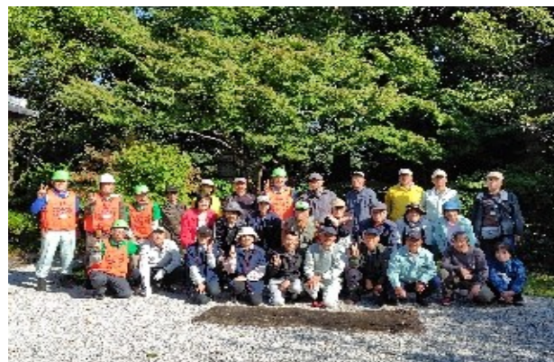
参加者全員での集合写真 皆さんお疲れさまでした。