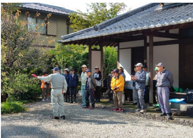
③庭園前の剪定方法の全体説明