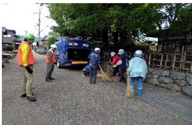
パッカー車への廃棄及び清掃作業