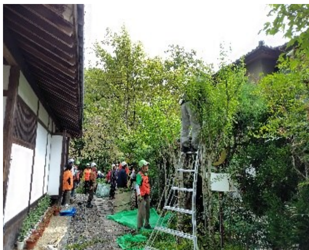
剪 定 前