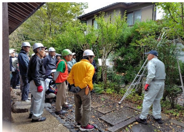
⑥入口～西側剪定の進め方説明