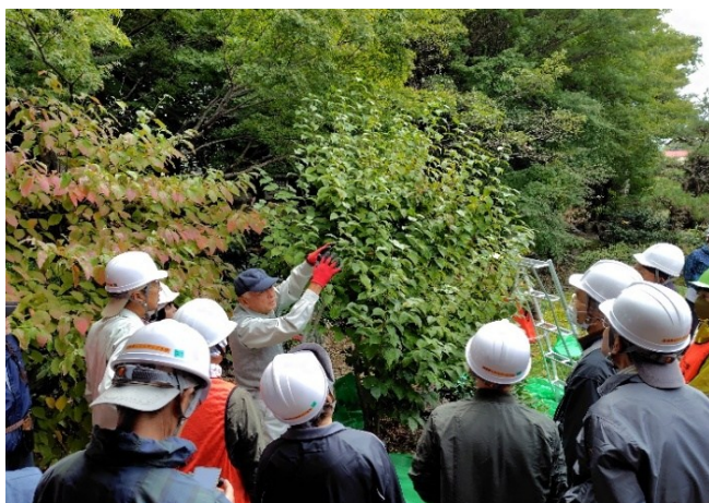
⑤庭園前剪定の進め方説明