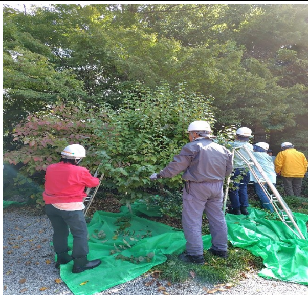
剪 定 前