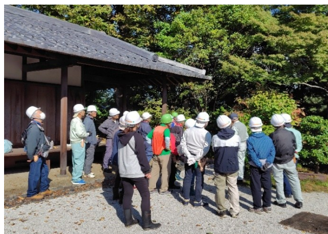
④庭園東側剪定の進め方説明