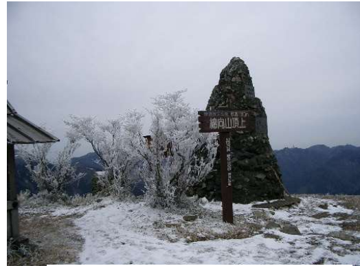
綿向山頂上とブナ林の霧氷