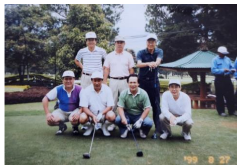
・ 中学校のゴルフ仲間と