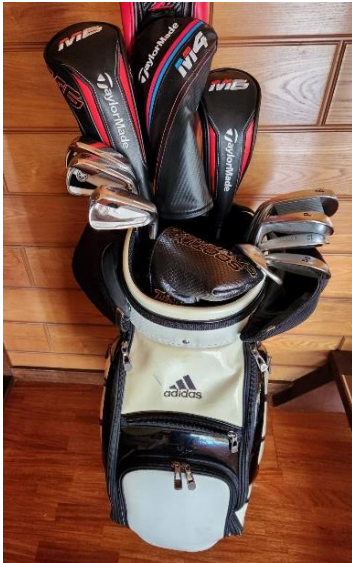
・愛用のゴルフバック