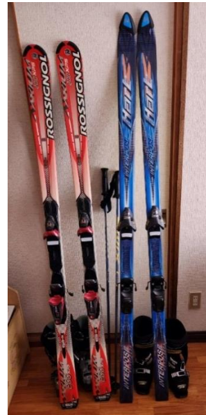
・スキー歴 53 年

1年間ゆっくり過ごしていましたが、何もしないで退屈感を感じていた時に同級生の友人から(40期生 園芸学科)レイカディア大学を紹介されました。その時は米原キャンパスに一度どんなものかなあーと見に行きました。そして、自分の家の庭木の剪定が出来ればいいなあーという思いでレイカディア大学に入学しました。