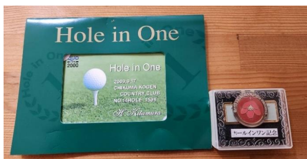
・ ホールインワン賞

ゴルフは50年のキャリアで52歳の時に、フロントナインは39。バックナインは38でベストスコア77を出しました。ホールインワンを1回達成しました。今でも中学校の同級生8名と月1回、回っています。もう40年くらいになると思いますが19番ホールの飲み会を非常に楽しんでます。希望は80歳くらいまで元気で回りたいのとエージシュート達成です。