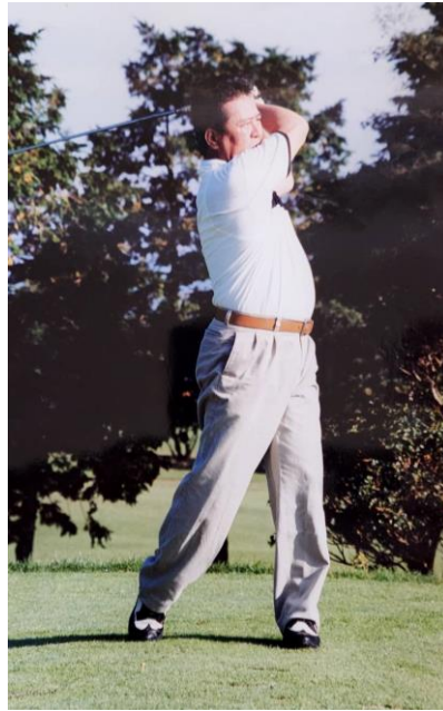
・見よ!!このスイングフォームを