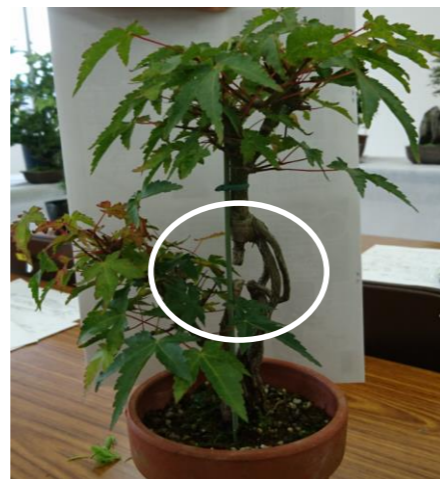
軸が途中で切れてます