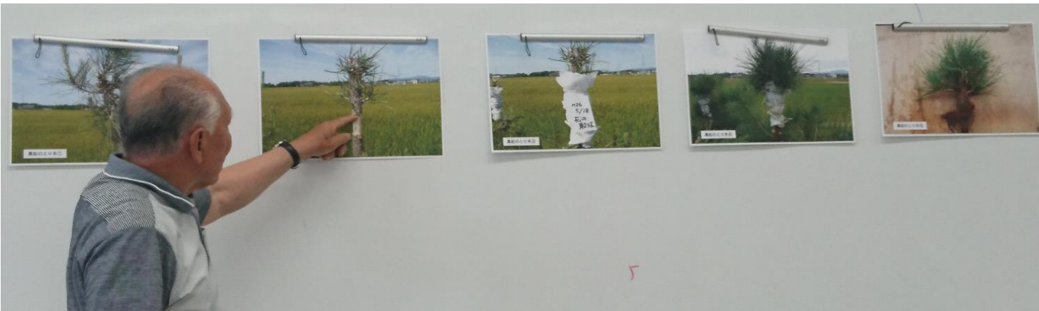
取り木の方法(約2年で仕上がります)