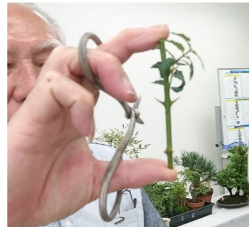
実山椒の挿し芽姿