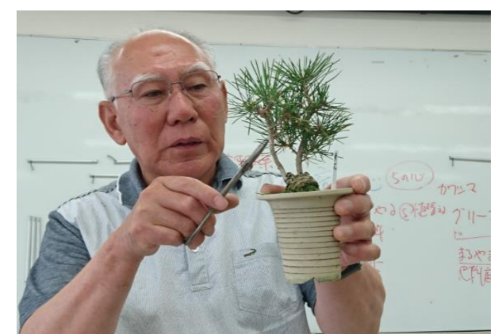
剪定後(今年の芽を剪定)