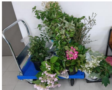
教材で提供芽 ~アナベル、ダンスパーティ他~