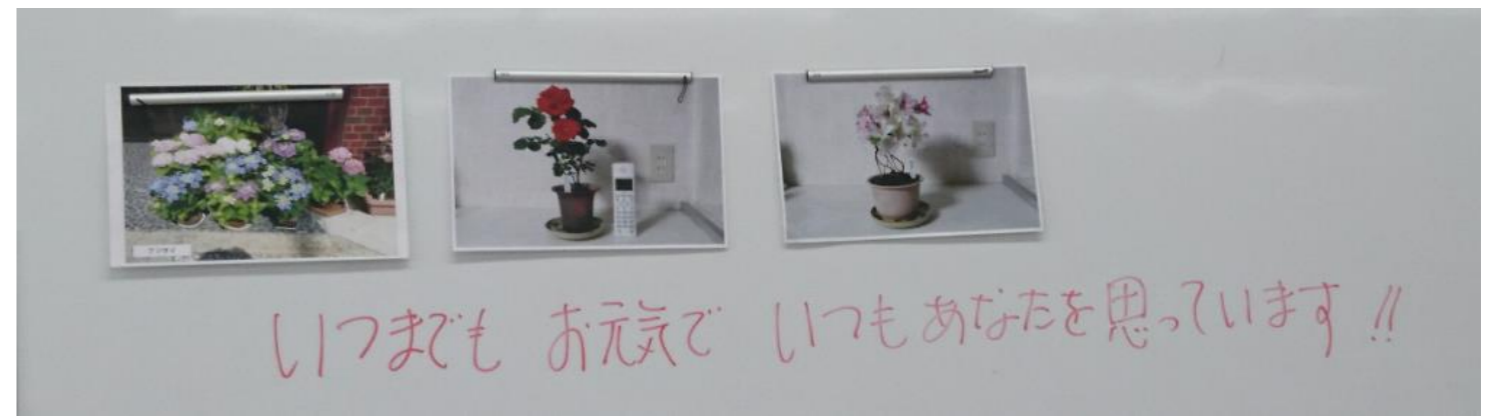
大辻先生のメッセージ ~2年間お世話になりました。~