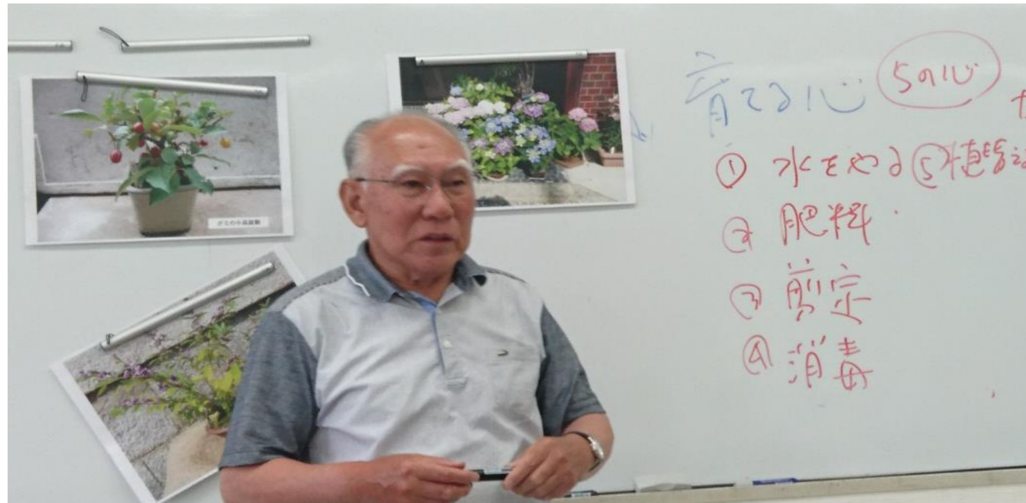
育てる心 ①水をやる ②肥料 ③剪定 ④消毒 ⑤植替える