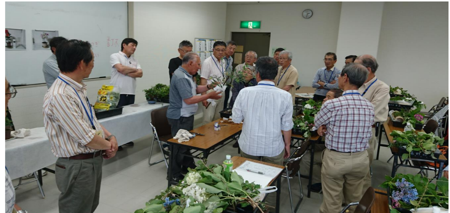
剪定実演 ~まるでマジック~