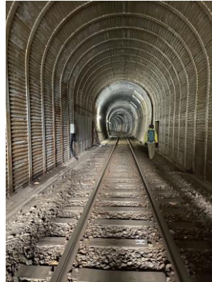
・線路ウォーキング