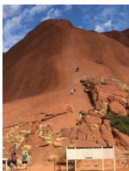
・オーストラリアのウルル(エアーズロック) ウルルは現地語