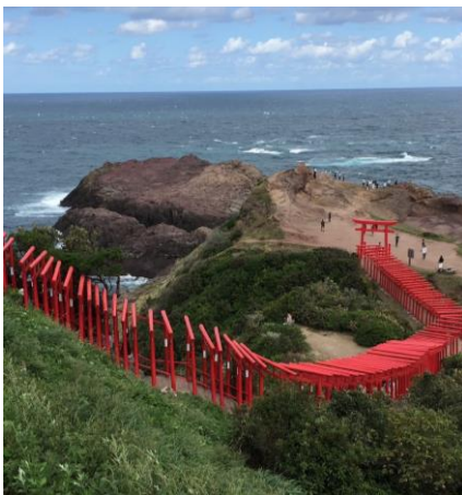
・山口県 元乃隅稲成神社