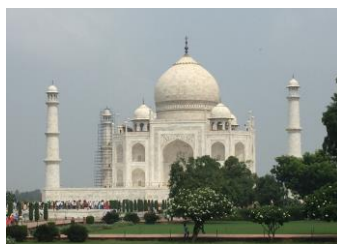
・インド タージマハル バリ島