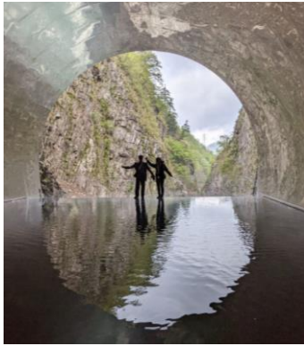
・新潟県 清津峡トンネル