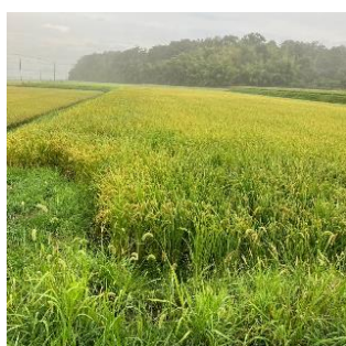
・収穫前の「みずかがみ」