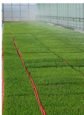
・水稻の育苗管理