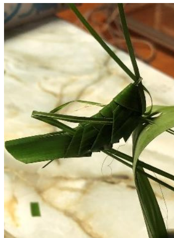
・シュロの葉でバッタを、手作りのオニヤンマ型虫除け