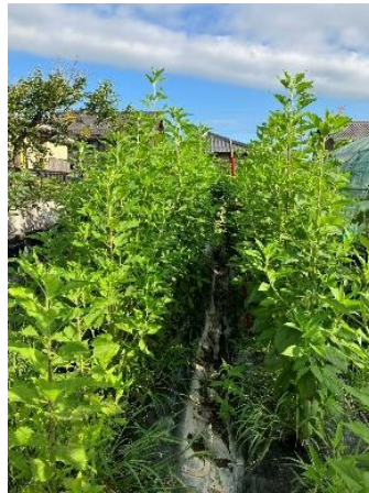
・菊いもが2mにも成長