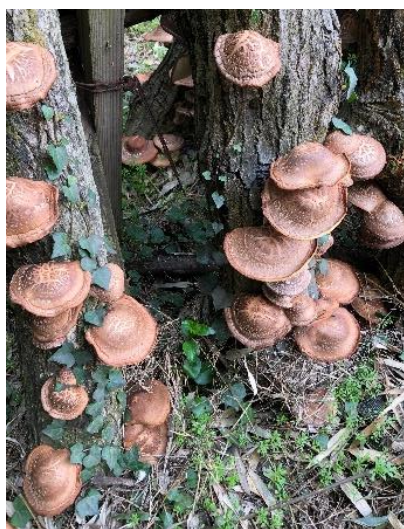
・シイタケの原木栽培

水稲をはじめ、レタス、菊いも、ラッカセイ、大根、冬瓜。果樹はユズ、ぶどう、柿、イチジクを栽培していますが、我流でしたので、特にトマト、さつまいも、レタスは収穫前に病気で減収になってしまいました。農業もしていましたし、直売所にも出荷していましたので、もっと品質の良いものを作りたいと思っていました。