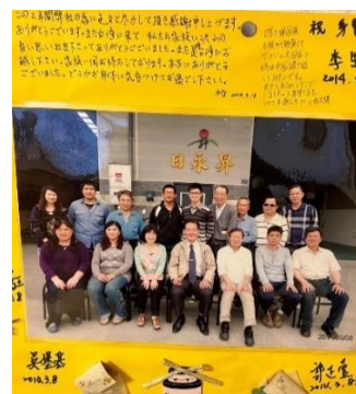
・台湾高雄市で2年間技術指導の時代