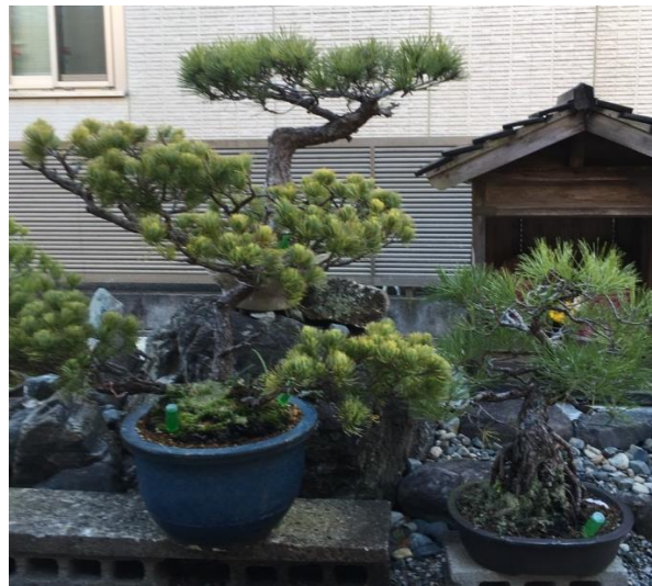
【右の盆栽が一番のお気に入りです】