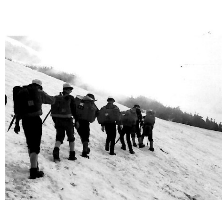
【全日本登山体育大会(白山)】