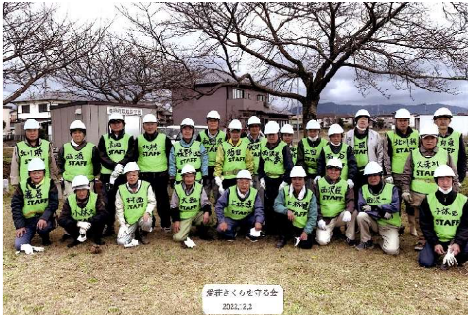
【愛荘 さくらを守る会】