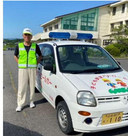
【小学校の交通安全パトロール】

2.人口減少期に入ったと言われています。今までの社会構造が非常なスピードで変化するなか、自助、共助、公助に対応する地域活動に取り組んでいきたいと考えています。