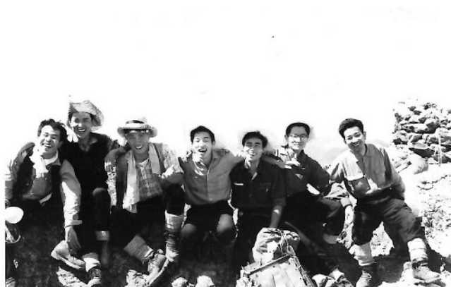
【S39 南アルプス縦走登山 左から3人目】